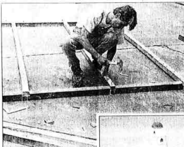
La creación de los carros alegóricos se realiza en los patios de la ESPOL, y la conclusión de la obra será el próximo 21 de mayo.

"Lo que se está comprando es lo que tiene que ver con la parte metálica, pero ahora ya se está trabajando con la madera porque