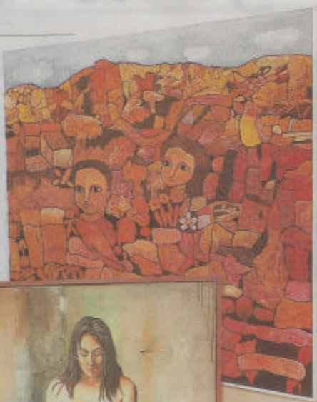
■ Arriba, la obra Paisaje rojo, del pintor ecuatoriano Félix Arriaza. A la izquierda, el cuadro Sudaca beña, del artista nacional Héctor Valverde.

De Szyszlo acotó que los artistas triunfadores "han usado el lenguaje pictórico correctamente y logran transmitirnos una impresión o sensación, es decir, hay una comunicación con el espectador. No son obras realizadas para autosatisfacción del pintor o de su manera de expresar, sino que más allá de eso comunican al público detalles tangibles e intangibles en el lenguaje mágico de la pintura".