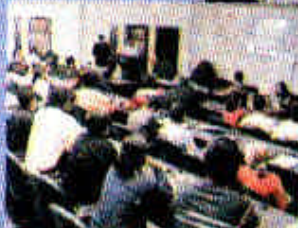
Presentando resultados de investigaciones hechas por los alumnos de maestría

INFORMACIÓN: CIBE-ESPOL, Campus Prosperina Km 30.5. Guayaquil-Ecuador.