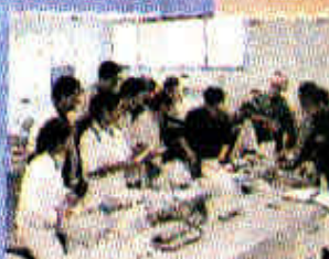
Estudiando los microorganismos del suelo