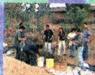
Elaborando abonos orgánicos a partir de subproductos de cosecha local

U. CENTRAL DEL ECUADOR - U. DE LA HABANA