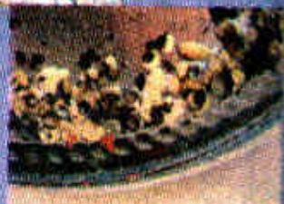
Produciendo embriones a partir de células de la flor de banano