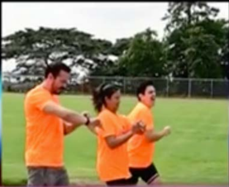
ESPOL PROMUEVE CARRERA 5K