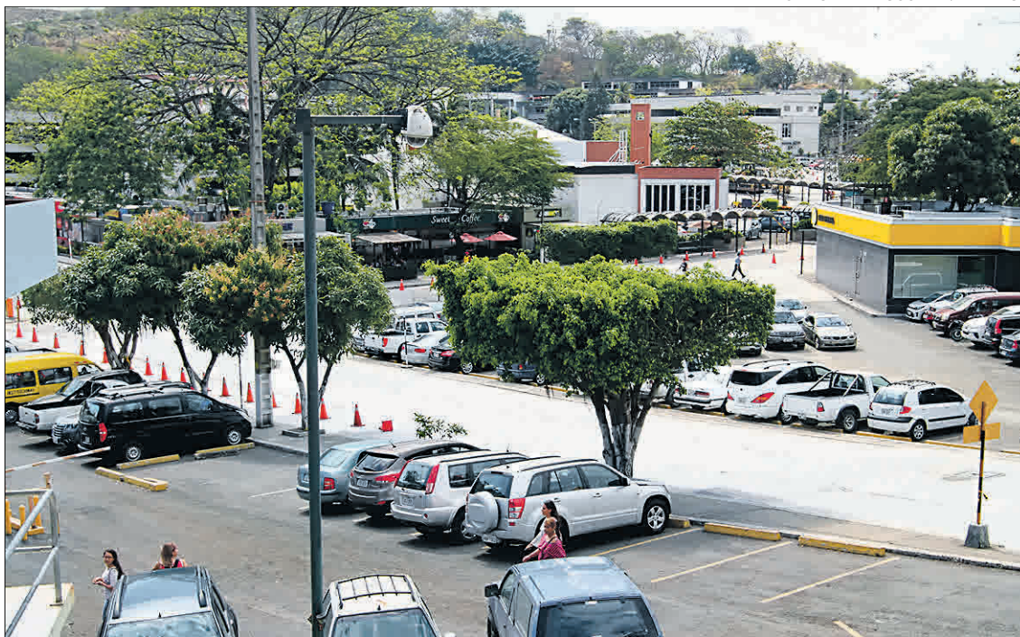
Seguridad. La Universidad Católica de Santiago de Guayaquil ha instalado cámaras en el 70 % de su campus.