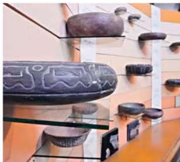
→ En el museo El Mogote se exponen cientos de piezas arqueológicas de las culturas Valdivia y San Pedro.

La entrada tiene un costo de $ 1. (I) et