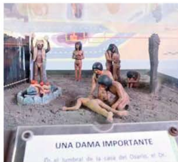
→ Representación de una de las fosas funerarias que fueron descubiertas en los alrededores del Complejo Real Alto.