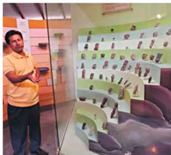
→ La cantidad de detalles que presentan sus estatuillas dan fe de la experticia de estas culturas en las técnicas de alfarería.