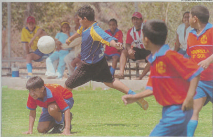
La escuela Pajarito Cantos se esforzó mucho por ganar el pasado domingo, pero no pudo contra Rosales II, que venció 1-0.