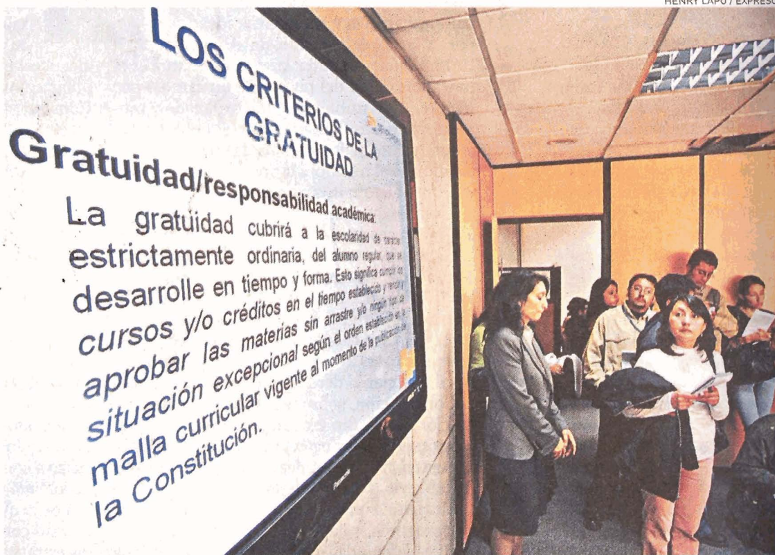
GRATUIDAD. Directivos de Senplades expusieron los principios y criterios para aplicar la gratuidad.

Esta nueva polémica se suma a la que se ha presentado