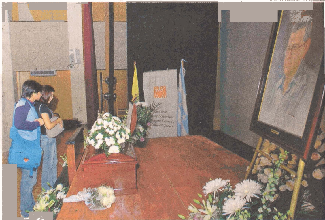
TRIBUTO. Sepelio del dramaturgo más representado del país es a las 12:00 en el Cementerio General

Sin embargo, serenidad y resignación se respiraba en los pasillos del teatro. Tal vez por lo que "todos sus amigos valoramos su legado y le ofrecimos varios tribu-