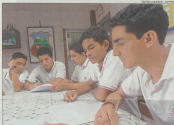
Los coordinadores del colegio Provincia de Bolívar se preparan con entusiasmo para el censo.

Como paso previo, los coordinadores, maestros guías de los colegios antes mencionados, y representantes de la Subsecretaría, harán el reconocimiento de la zona el próximo viernes 18 de noviembre. De acuerdo con la organización prevista, los alumnos recibirán charlas de capacitación durante los días 21, 22 y 23 de este mes.