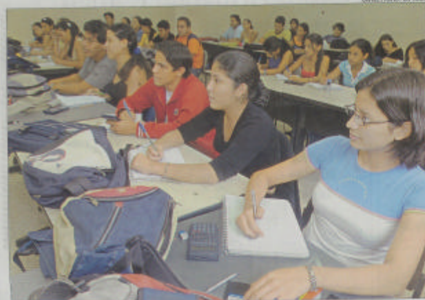
Los estudiantes que se forman en las universidades tienen más alternativas para escoger.