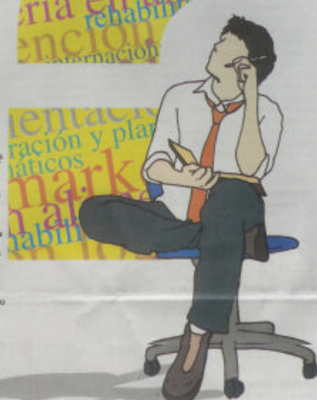
ILUSTRACIÓN: CARLOS RODRÍGUEZ ESPINOSA