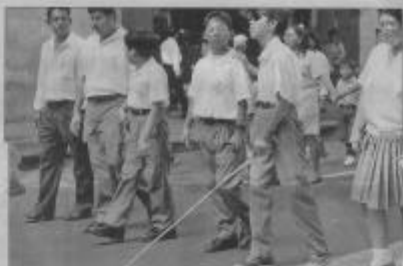
Los mejores bachilleres discapacitados se beneficiarán con el 2% de las becas que concedan las universidades, según la ley.

Indica que también han pedido más autonomía para esa entidad, lo que implica la asignación de un mayor presupuesto para ampliar su capacidad operativa. "Presumimos que el IECE debería reclamar, inclusive, los fondos necesarios para financiar la línea de becas, si persiste esa disposición en la nueva ley".