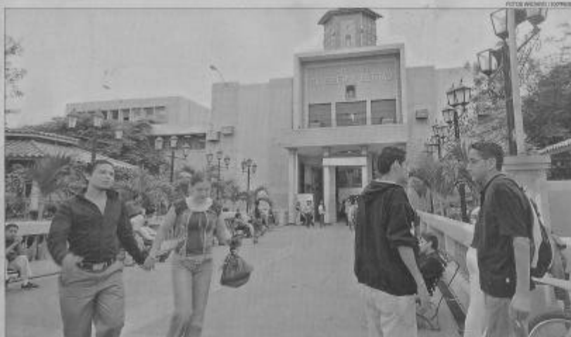
Las cerca de 70 universidades y escuelas politécnicas del Ecuador deben conceder el 10% de sus programas de becas al IECE.